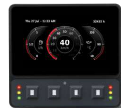
新しくなったエンジンモニタ