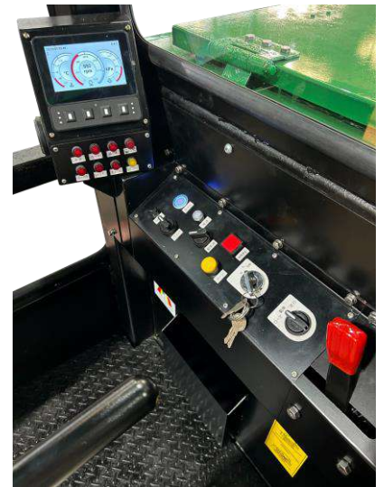
デザインを一新した操作パネル